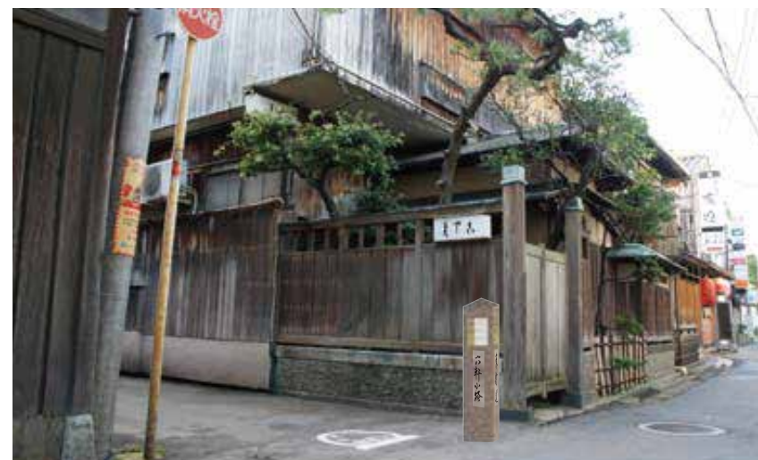
※写真は完成イメージです。

「市民の皆様には喜ばれるサインを作らないと意味がない…」ただ単にこちらの寄贈したいサインを設置したい場所に設置するのではなく、市や諸団体の意向を汲みながら、調整を図る作業は非常に大変でした。何度も社内打ち合わせを重ね、何度もプランを描き直し、何度も市民団体の会議に足を運び、幾多の苦難を経てようやくまとまりました。